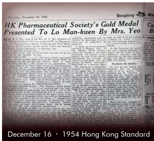
December 16, 1954 Hong Kong Standard